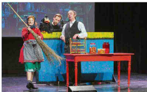
Spass und Spannung bei der kleinen Hexe.